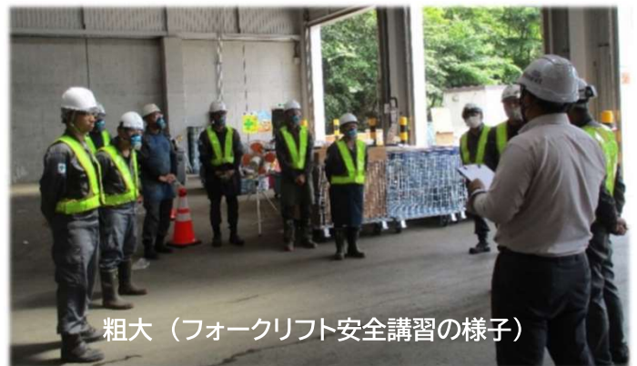
粗大（フォークリフト安全講習の様子）