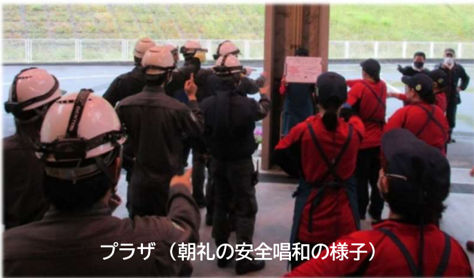
プラザ（朝礼の安全唱和の様子）